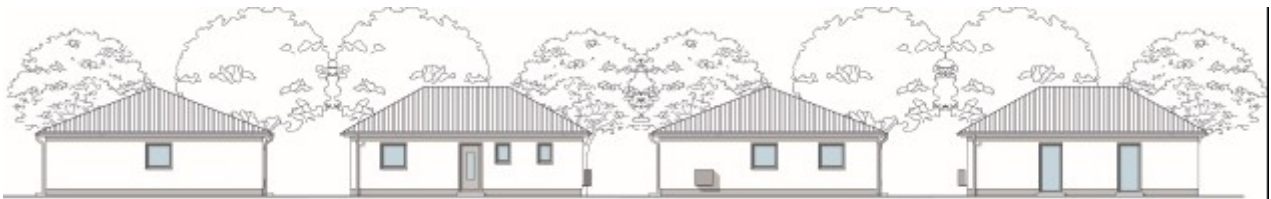
KHBU1/P-K-W22+H - Stand 01.03.2018