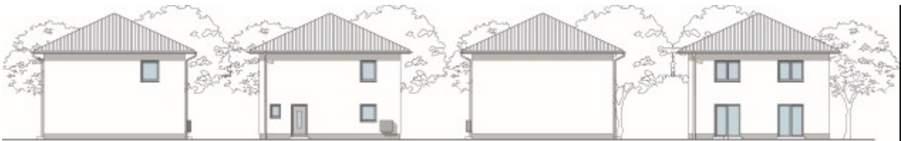
KHSV1/P-K-Z25+H - Stand 01.03.2018