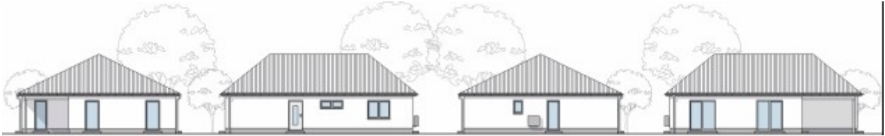
EFBU1/P-K-W25+H - Stand 01.06.2018