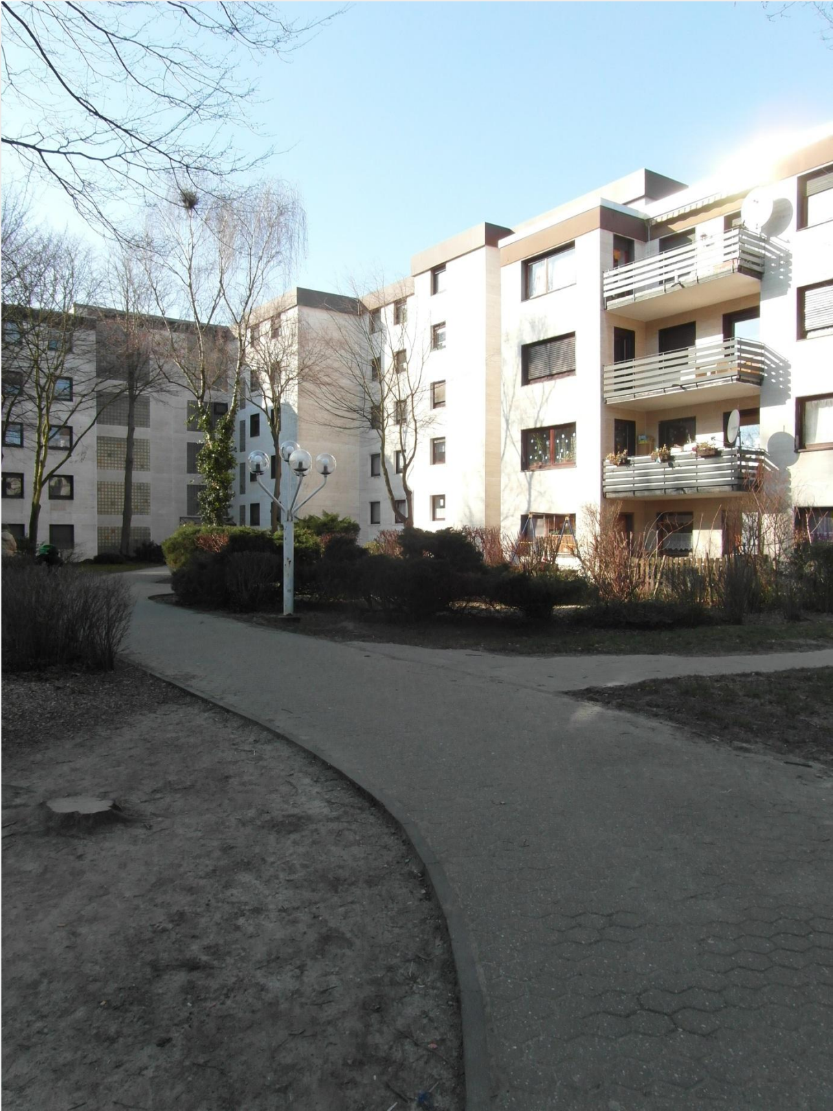
Einer der Zuwege