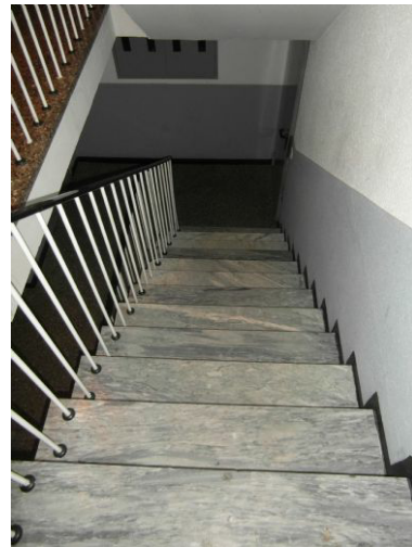
Zugang zum Keller