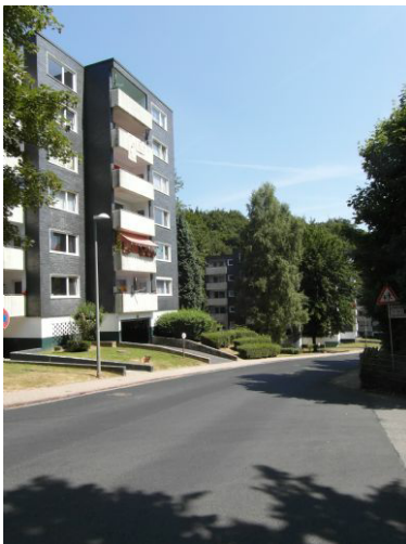
Hambergerstrasse; Hier mit Sicht auf die Garagenei