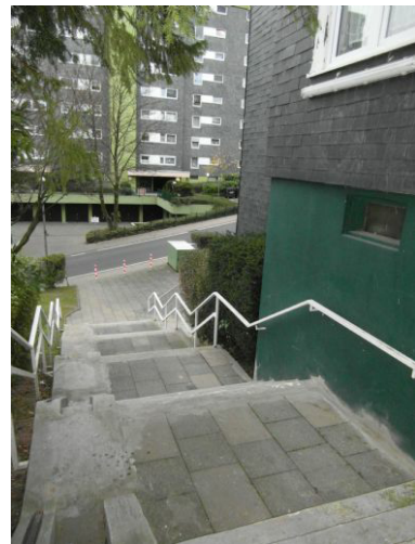
Zugang zum Haus