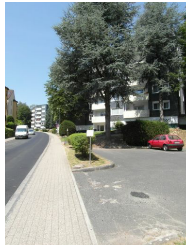
Weg von der Bushaltestelle zum 27-Familienhaus