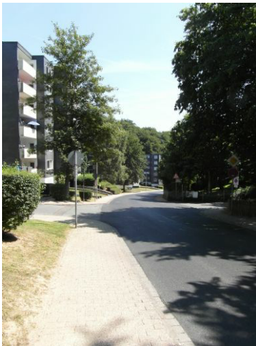
Hambergerstrasse Richtung Bushaltestelle