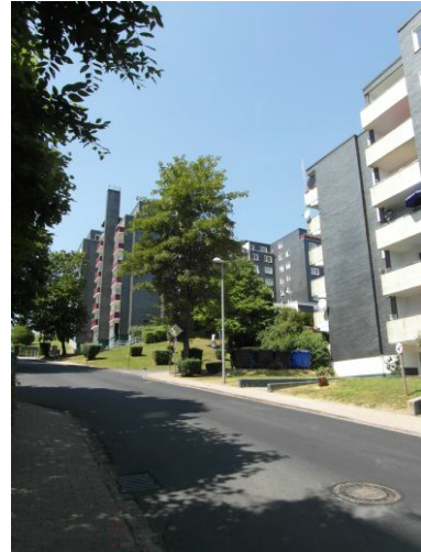
Blick auf das 27-Familienhaus nebst Nachbarschaft