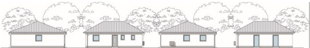
KHBU1/P-K-W22+H - Stand 01.03.2018