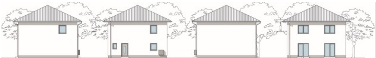
KHSV1/P-K-Z25+H - Stand 01.03.2018