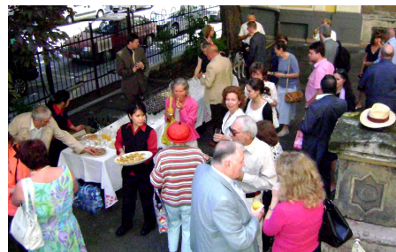
Abschiedsempfang im Garten der Kirche