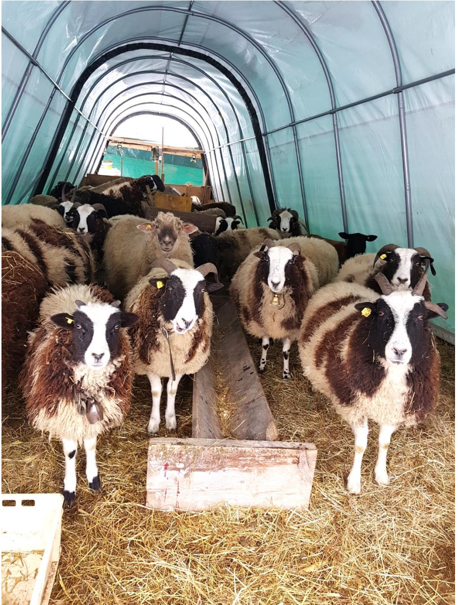
Im mobilen Winterquartier.