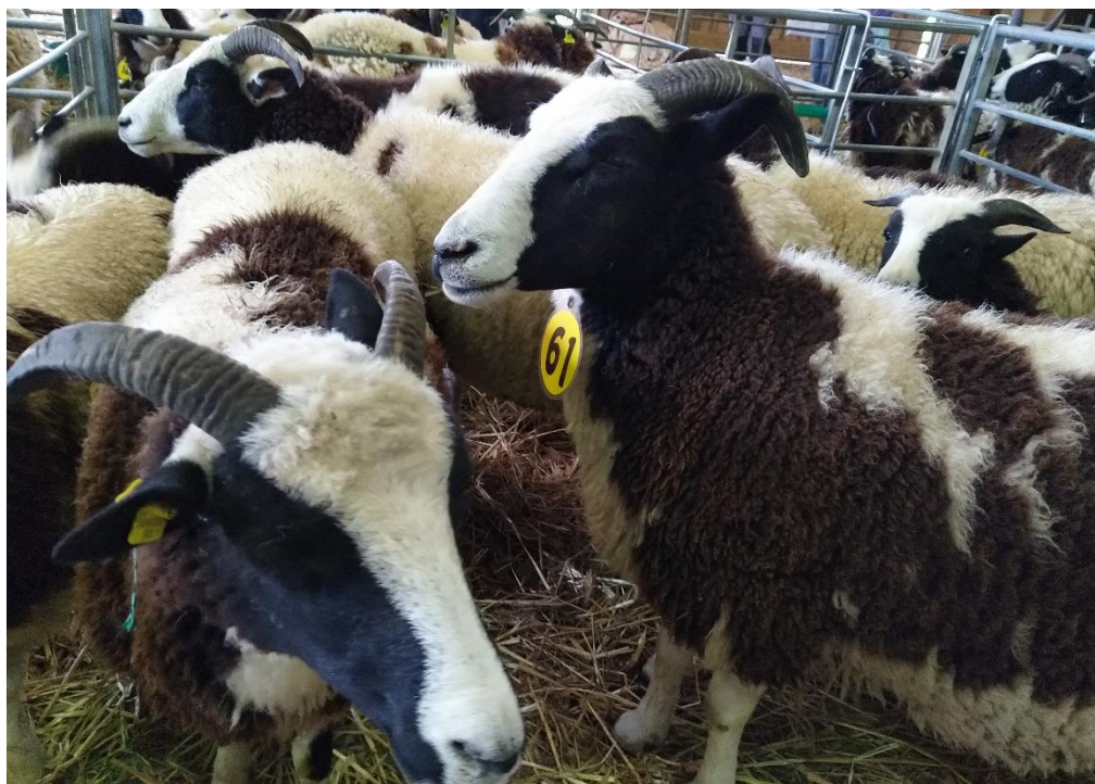
Tiere von André Meister.