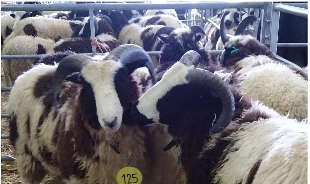
Bock-Lämmer von Eva Stössel.