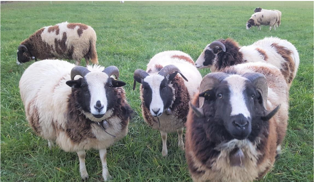
Mitte Januar und immer noch so viel Gras!