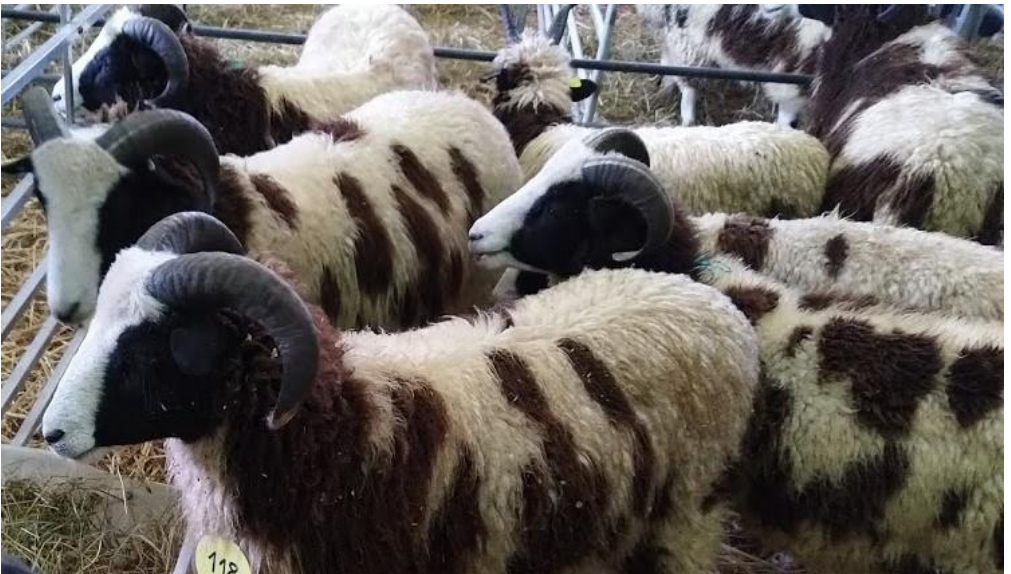
Bock-Lämmer von Res und Vreni Feldmann.