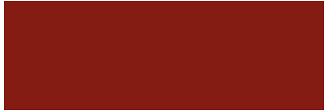
Cottage Red RR29/SS0758