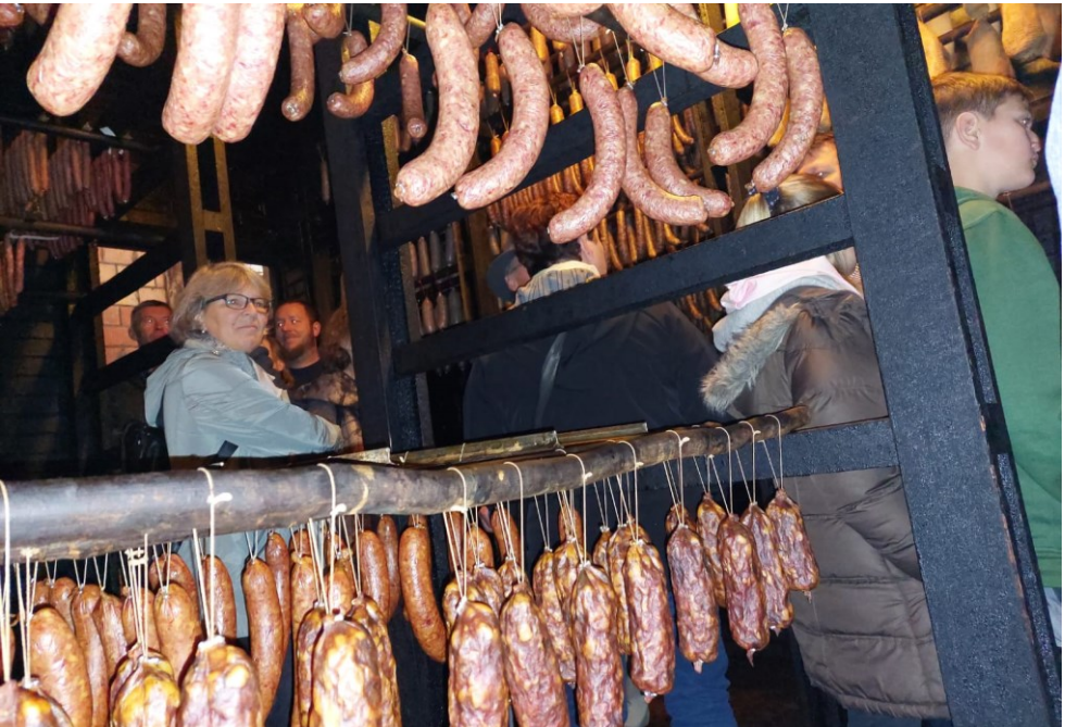
Der Himmel hängt voller Würste! Definitiv kein Ort für Veganer und Fleischverächter!